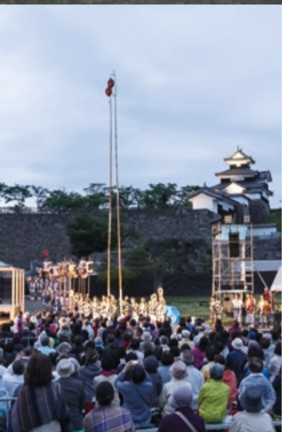
影向のボレロ 舞台美術 加川広重