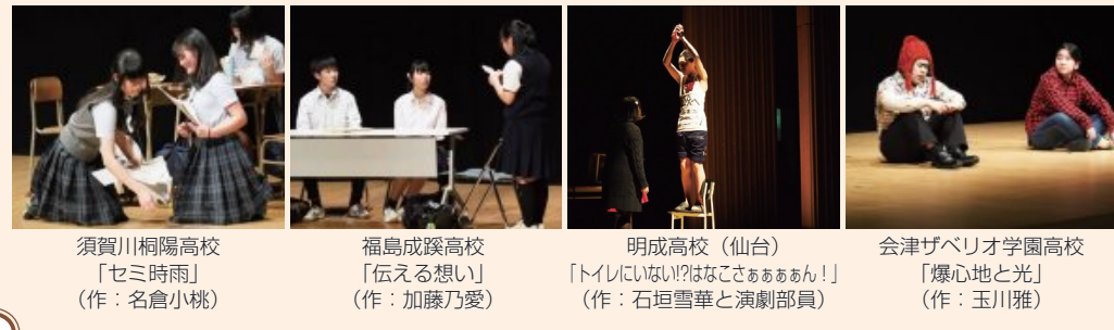
須賀川桐岡高校「せし時雨」(作：名倉小桃) 福島成蹊高校「伝える想い」(作：加藤乃愛) 明成高校(仙台)「トシにない? はなごさあまねん!」(作：石垣雪音と演劇部員) 会津バレイオ学園高校「爆心地と光」(作：玉川雅)