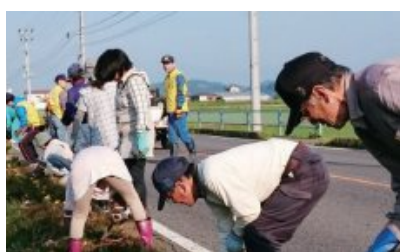
五箇花街道 マリールールの植え付け

東京一極集中の動きは現在進行形である。そのような中、幼い時感じた母のぬくもりをこの故郷で感じることが出来るようなそんな故郷にしたいという思いで今後も活動したい。