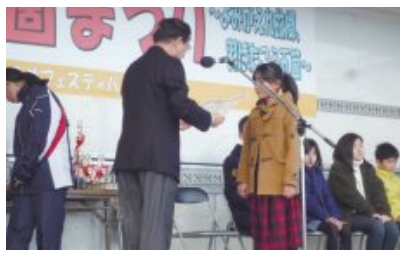
五箇まつり 小学生川柳表彰式

平成14年、私たちの組織は産声を上げた。この頃から少しずつ地域の活力が落ちつつあるのを肌で感じていたので、私たちの仲間で地域の為に出来る事が無いかと平成12年から議論を重ねた末に組織の立ち上げに至った次第である。