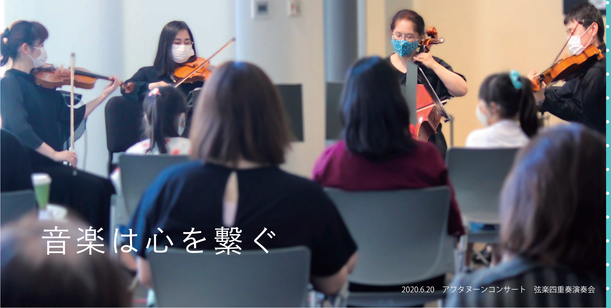
2020.6.20 アフタヌーンコンサート 弦楽四重奏演奏会