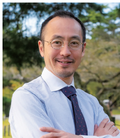
福島県立医科大学 白河総合診療アカデミー 教授